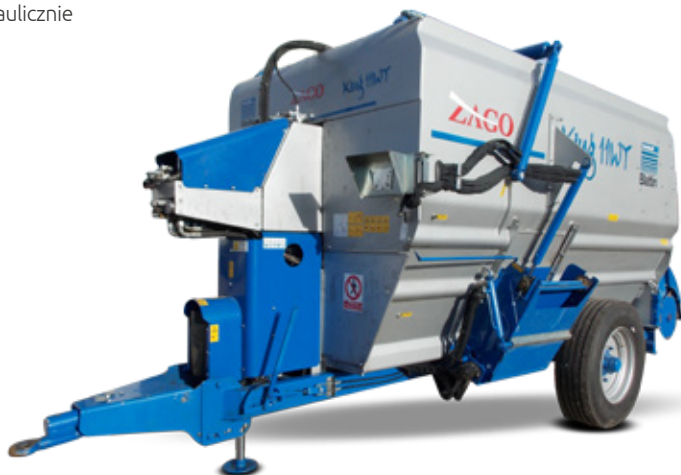
Perfekcyjne rozdrabnianie w krótkim czasie